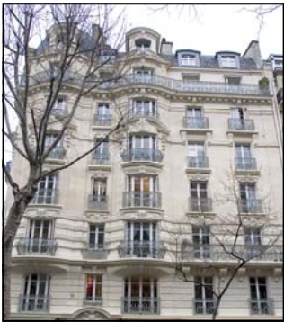
104 avenue Ledru Rollin, Paris XII