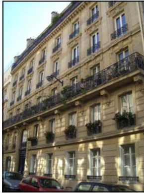
9 rue de la Bienfaisance, Paris VIII