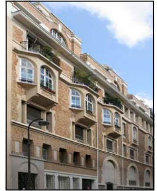
4/6 rue Albéric Magnard, Paris